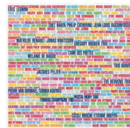
Igloo - IGL 214 - LP

> www.wooha.be/pmt > www.igloorecords.be