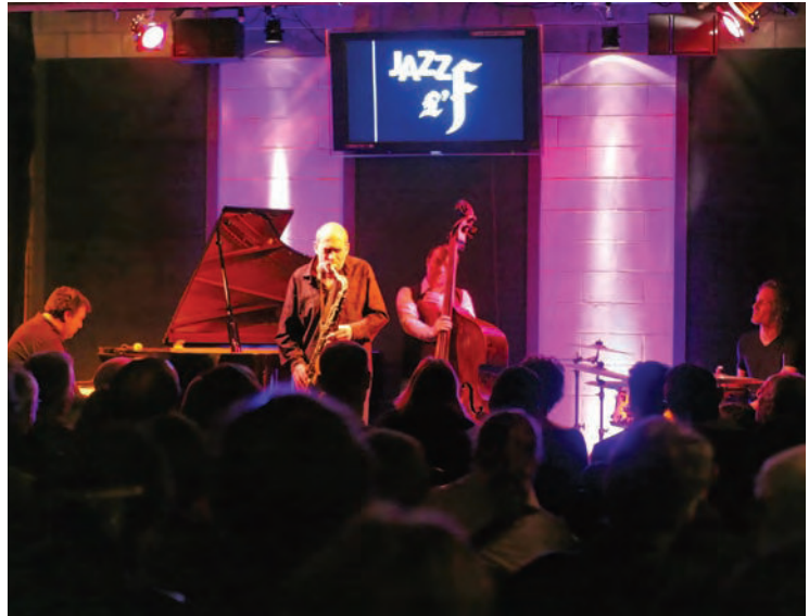
Jazz l'F Rue Himmer, 43 - 5500 Dinant