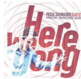
Enja - ENG-95372