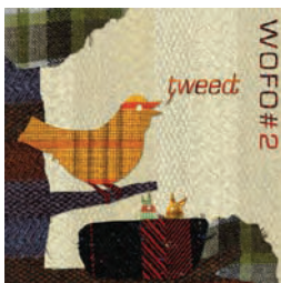
Wofo - WOFO#2