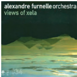
Mogno Music - J034

> www.nathalieloriers.com > www.dewerf.be