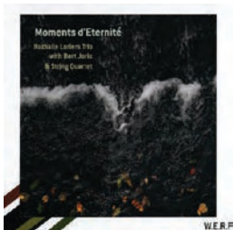
W.E.R.F. - WERF 078