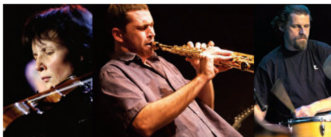
© Bernard Rosenberg / Ian Gunn / Jos L. Knaepen

> www.myspace.com/cecilebrocheetiennebouyerduo > www.igloorecords.be