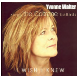
Ywako Music - YK 8510

> pascalschumacher.com > www.myspace.com/pschumacher