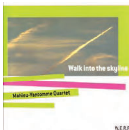
W.E.R.F. - WERF 077

> www.myspace.com/alexandrefurnelle > www.mognomusic.com